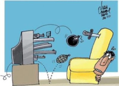
CABRAL, I. Disponível em: < http://www.ivancabral.com >. Acesso em: 18 jul. 2012.

DAHLBERG, L. L.; KRUG, E. G. Violência : um problema global de saúde pública. Disponível em: < http://www.scielo.br >. Acesso em: 18 jul. 2012 (adaptado).