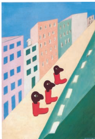
Tarsila do Amaral