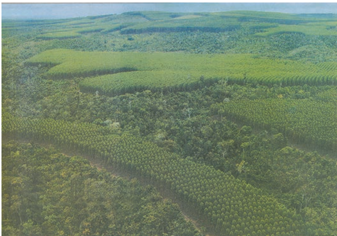
JB Ecológico. Nov. 2005