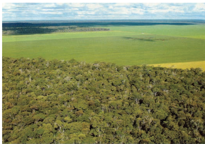
Revista Veja. 12 out. 2005.

“Amo as árvores, as pedras, os passarinhos. Acho medonho que a gente esteja contribuindo para destruir essas coisas.”